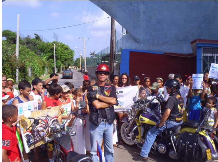
Bienvenida a los participantes por el oficial del medio ambiente