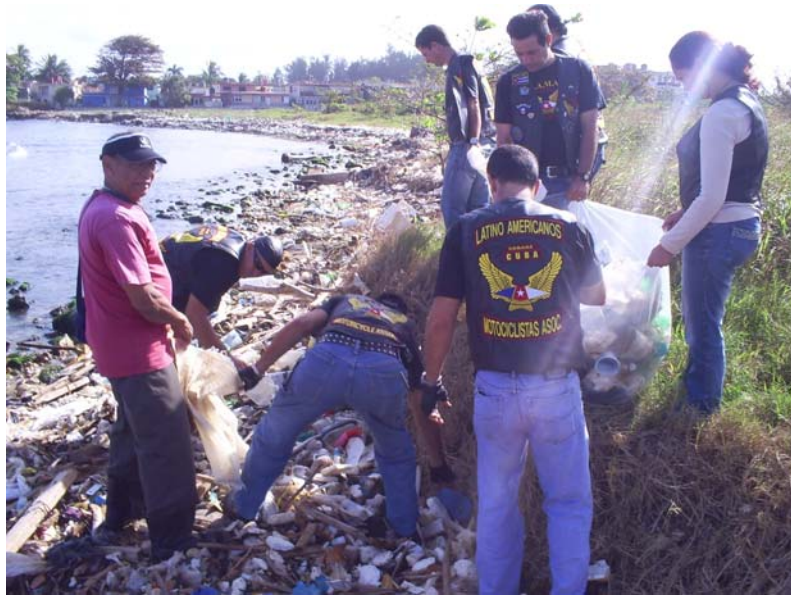
Motociclistas en la recogida de desechos sólidos