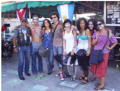
Nuevos jóvenes ecologistas que se unen al proyecto