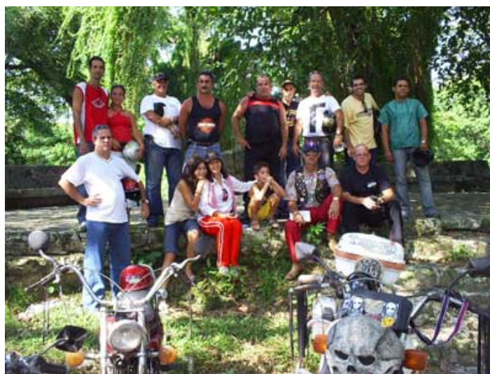
Fundadores del proyecto

http://motosclasicascuba.havanatrends.com/motosclasicascuba/especial_medioambiente.htm