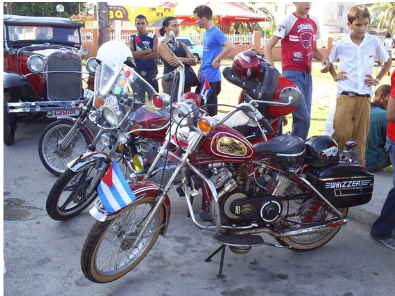
Playita 16, 19 de septiembre de 2009