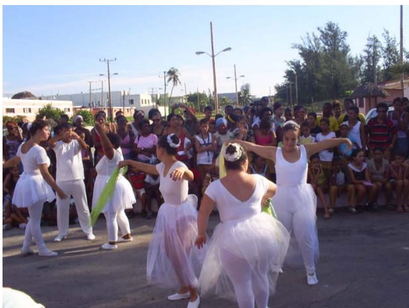
Actúan integrantes del proyecto "Buscado mi espacio" Playita 110 - 04/01/09

Ver: http://hobbiesenred.havanatrends.com/hobbiesenred/medioambiente.html