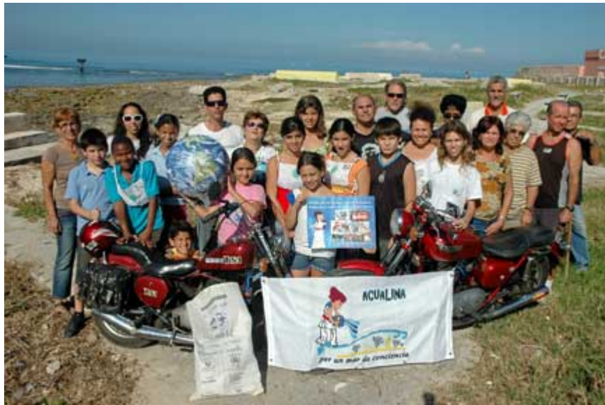
Actividad Playita 110 20/09/08

Ver: http://hobbiesenred.havanatrends.com/hobbiesenred/medioambiente.html