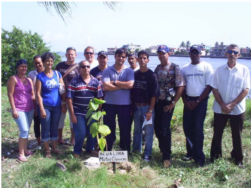
Desembocadura río Quibú, siembra de árboles