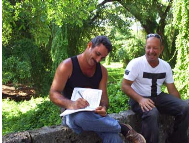
Pilotos firmando el Libro de Registro