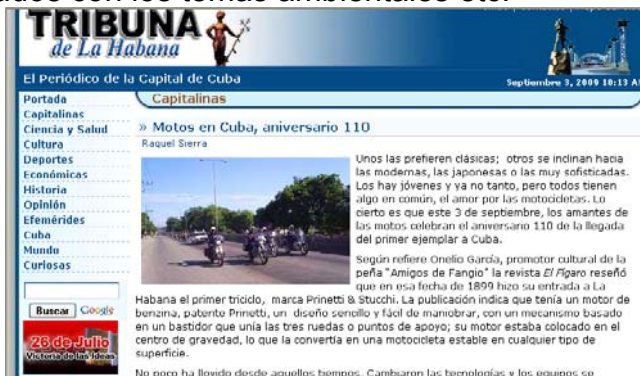
Primera Feria de "Motos en Cuba" agosto 2009

Ver: http://www.tribuna.co.cu/etiquetas/2009/septiembre/3/motos-cuba.html